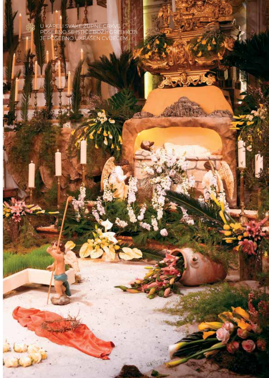
U KAPELI SVAKE ŽUPNE CRKVE POSEBNO SE ISTIČE BOŽJI GREB KOJI JE POSEBNO UKRAŠEN CVIJEĆEM.